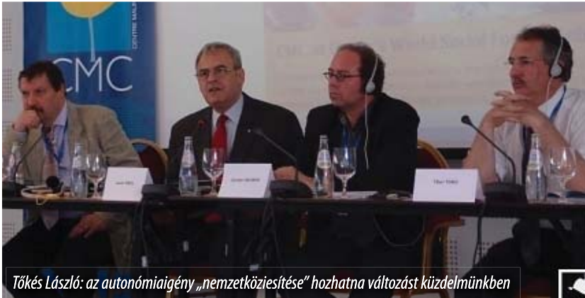
Tőkés László: az autonómiaigény „nemzetköziesítése” hozhatna változást küzdelmünkben

Az Európai Szabad Szövetség (EFA) háttérintézményeként működő Maurits Coppieters Központ Szovátán megtartott autonómia-konferenciáján Tőkés László , az Erdélyi Magyar Nemzeti Tanács elnöke úgy fogalmazott: míg az autonómiaigényről való lemondást rögzítő magyar-szlovák megállapodás ismert, Romániában csak a következőképpen látszanak egy vélhetően létező, titkos megállapodásnak.