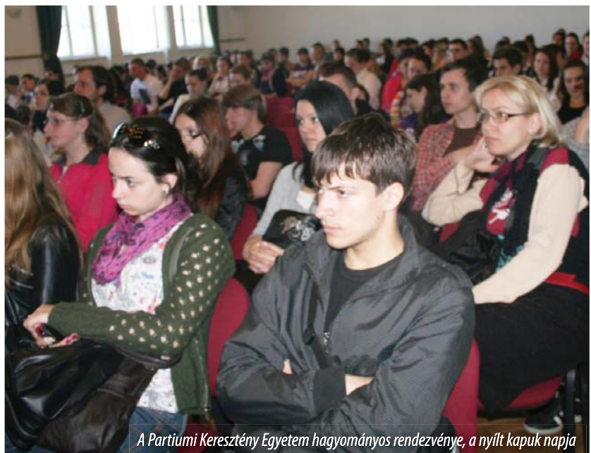
A Partiumi Keresztény Egyetem hagyományos rendezvénye, a nyílt kapuk napja