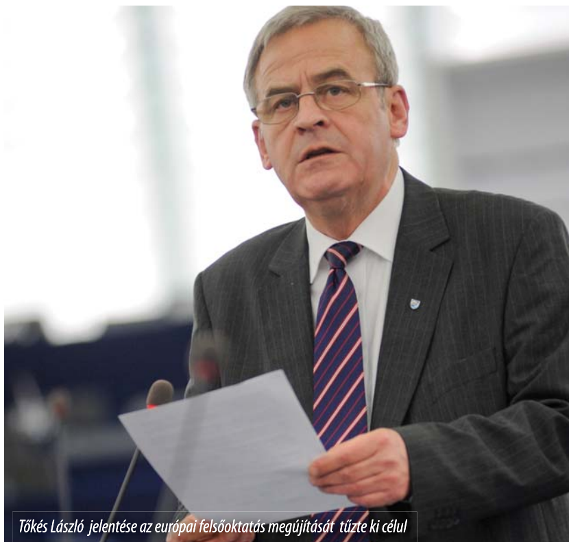
Tőkés László jelentése az európai felsőoktatás megújítását tűzte ki célul

A felsőoktatás közös európai érték . Megújítása csakis az uniós, a tagállami és a regionális szint együttes szerepvállalásával képzelhető el. Azt is figyelembe véve, hogy a felsőoktatás meghatározó szerepet játszhat a társadalmi befogadás elősegítésében, a Jelentés arra hívja fel a felsőfokú oktatási intézményeket, hogy az előbbiekkal, illetve „külső partnereivel” – a helyi önkormányzatokkal, a civil szervezetekkel és az üzleti szféra szereplőivel – összefogva, minden eddigénél komolyabb erőfeszítéseket tegyenek annak érdekében, hogy minden társadalmi csoport, a hátrányos