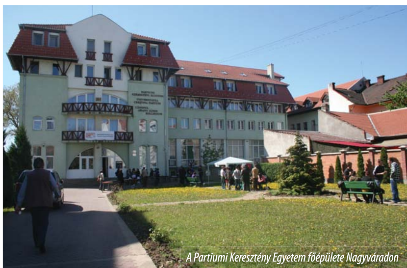
A Partiumi Keresztény Egyetem főépülete Nagyváradon