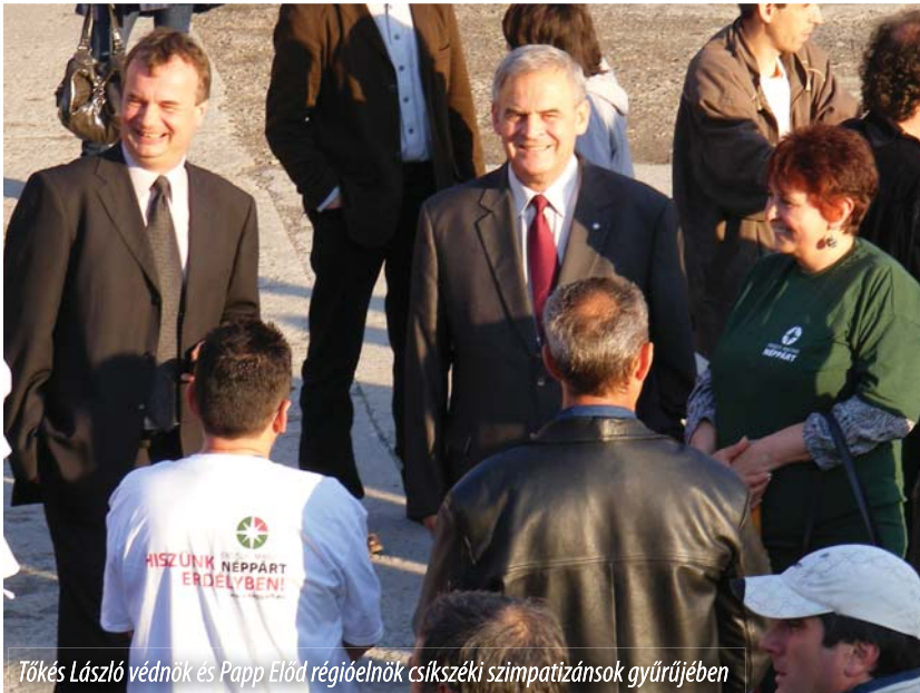
Tőkés László védnök és Papp Előd régióelnök csíkszeréki szimpatizánsok gyűrijében

Tőkés László EP-képviselő, az Erdélyi Magyar Nemzeti Tanács elnöke a június 10-i helyhatósági választásokat megelőző két hétben országos kampánykörúton vett részt, amelynek állomásain az általa védnökölt Erdélyi Magyar Néppárt jelöltjei mellett korteskedett. Indulása előtti napon, május 25-én Balog Zoltánnal , az Emberi Erőforrások Minisztériumának úján kinevezett vezetőjével a bihardiószegi romatelepre látogatott, majd Monospetriben – a Néppárt partiumi vezetőinek szervezésében – közösségi találkozón vett részt. A tulajdonképpeni körút másnap Szatmár megyében, a borairól méltán nevezetes Dobrán kezdődött és a történelmi Szilágysághoz tartozó Tövishát településein ( Bogdánd, Lele ) folytatódott. A helyi néppárti jelöltek arról tájékoztatták védnöküket, hogy bár alig kezdődött el a kampány, máris sok támadás érte őket a vetélytársak részéről. Támogatóikat megfélemlítették, és az emberek nem mernek hangot adni elégedetlenségüknek. Tőkés László arra bízta a közösségi találkozók résztvevőit, hogy ne féljenek a jelenlegi hatalom nyomásától, ne engedjenek a provokációknak, hanem vállalják saját meggyőződésüket.