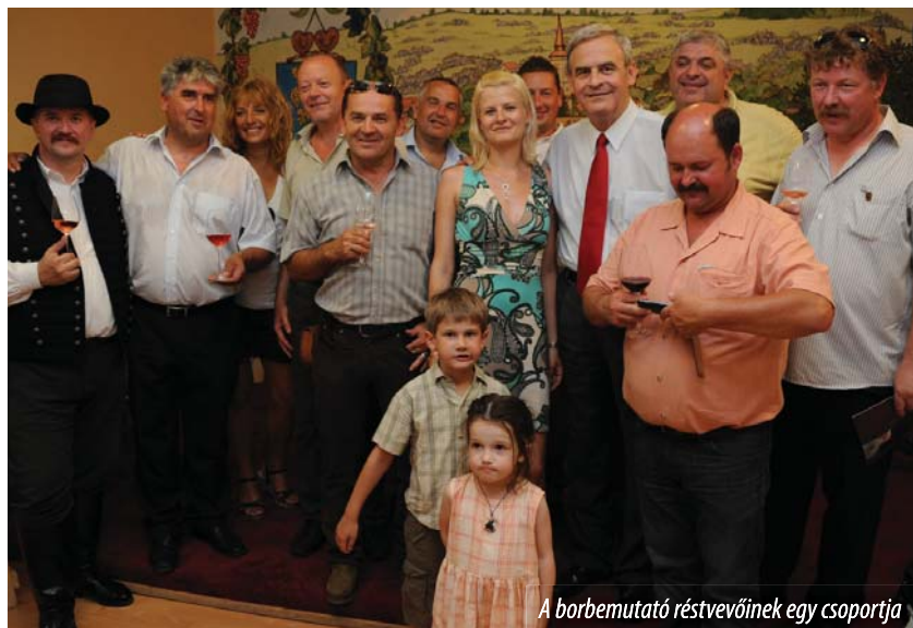
A borbemutató résztvevőinek egy csoportja