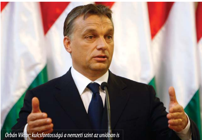
Orbán Viktor: kulcsfontosságú a nemzeti szint az unióban is

Állást foglalt amellett is, hogy a nemzeti politikák stabilizálása érdekében, de uniós szinten is dolgozzanak ki új módszereket, újító eszközöket. Mint mondta, ebből a szempontból tanulmányozta az amerikai és a francia politikai rendszert, és azok számos elemét sikeresnek találta, közöttük a nemzeti konzultációt, illetve a médián