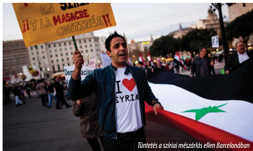
Tüntetés a szíriai mészárlás ellen Barcelonában