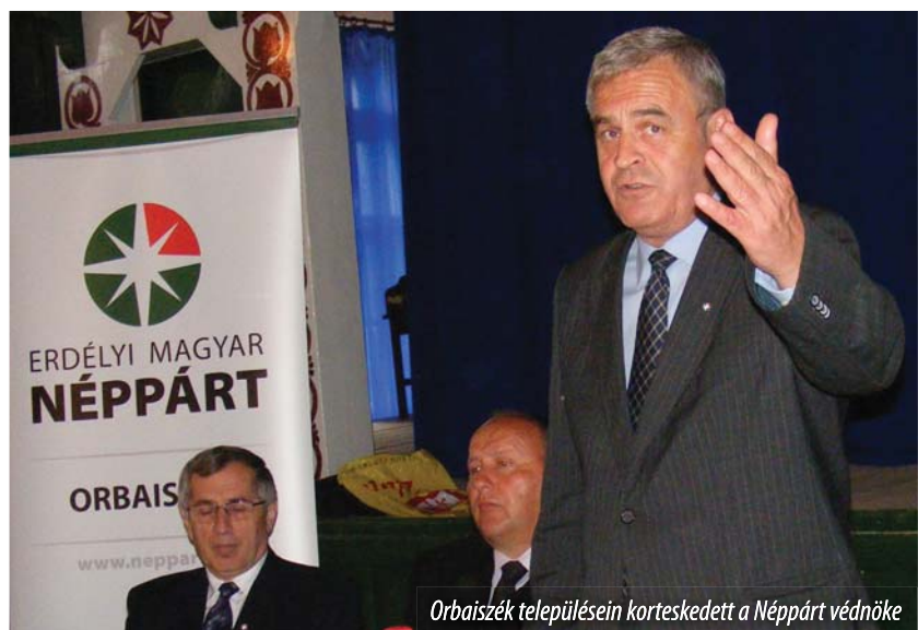
Orbaissék településén korteskedett a Néppárt védnöke

Az Erdélyi Magyar Néppárt védnöke június elsején ismét Maroszékre látogatott, ahol a Sóvidék néhány településének ( Szováta ,