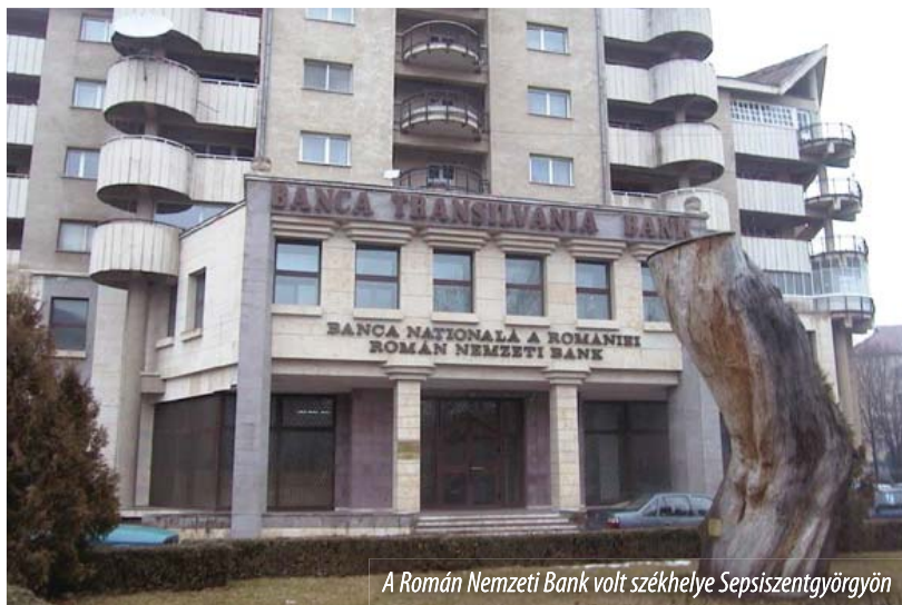
A Román Nemzeti Bank volt székhelye Sepsiszentgyörgyön