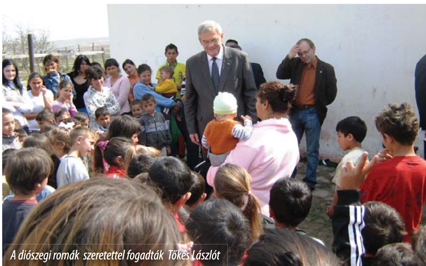
A diószegi romák szeretettel fogadták Tőkés Lászlót

Tőkés László európai parlamenti képviselő, az Erdélyi Magyar Nemzeti Tanács (EMNT) elnöke 2012. április 6-án, nagypénteken a diószegi romatelepre látogatott, ahol húsvéti ajándécsomagokat osztott ki a helyi iskolások között.