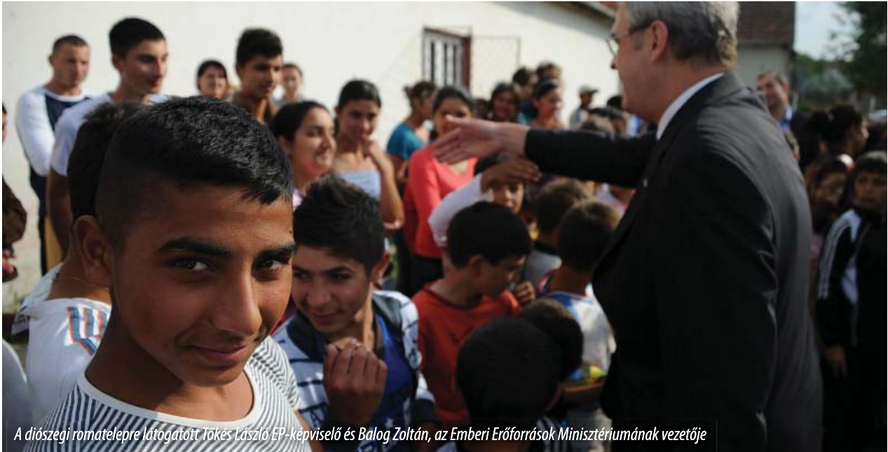
A diószegi romatelepre látogatott Tőkés László EP-képviselő és Balog Zoltán, az Emberi Erőforrások Minisztériumának vezetője

Szombaton Bihardiószegen, valamint Monospetriben kezdte meg mintegy két héten át tartó kampánykörútját Tőkés László , az Erdélyi Magyar Néppárt (EMNP) védnöke.