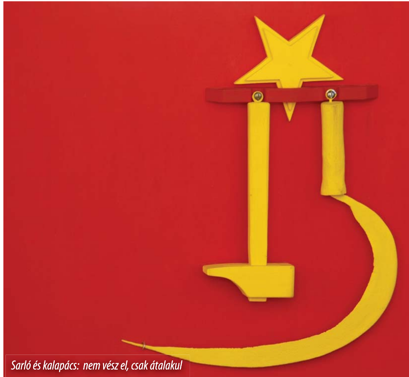
Sarló és kalapács: nem vész el, csak átalakul

Az elismerésre méltó erőfeszítések mellett viszont fonák és már-már cinikus, ahogyan Tabajdi képviselő úr újbólcsak pártos előítéletei hangoztatására lyukad ki, amikor is „a Fidesz erdélyi tevékenységének, a Nyíró -újrateremtés ügyének, vagy Kövér László erdélyi kampánykörútjának” az emlegetésével próbálja relativizálni a nacionalista román kormányzat felelősségét. A szocialista kisebbségpolitikus csak azt felejt el kimondani, hogy a magyarellenességen jeleskedő Szociálliberális Szövetség (USL) vezető politikai ereje nem más, mint a román Szociáldemokrata Párt (PSD), az MSZP testvérpártja, a Hannes Swo-