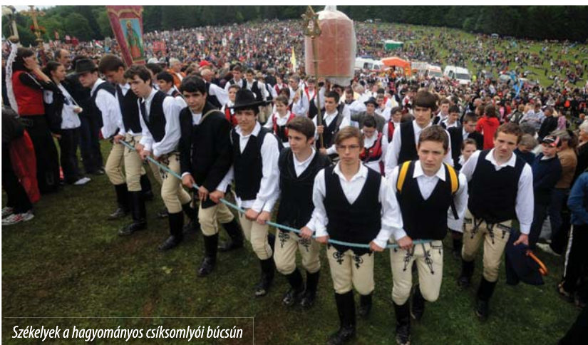
Székelyek a hagyományos csíksomlyói búcsún

– Regionalizálás... Látja, Traian Băsescu államfő mégiscsak az egyik legjobb román politikus, egyetlen „gumicsonttal” el tudta érni, hogy mind a kormánypárt, mind az ellenzék úgy táncol, ahogy ő füttyöl. Ami pedig a „magyarok országát” illeti: hogyha én moldvai, bánági, erdélyi román vagy oltyán volnék, komolyan megsértődnék azon, hogy a területi-adminisztratív újjászervezése kapcsán egyfolytában csak a magyarokról szól a fáma, mint hogyha Romániában csak a magyaroknak lenne regionális identitása. Ez azonban