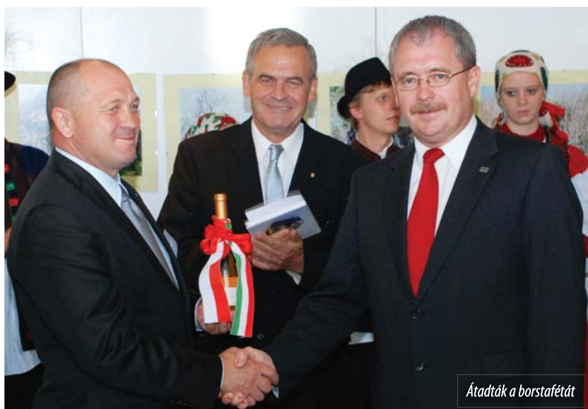
Átadták a borstafétát