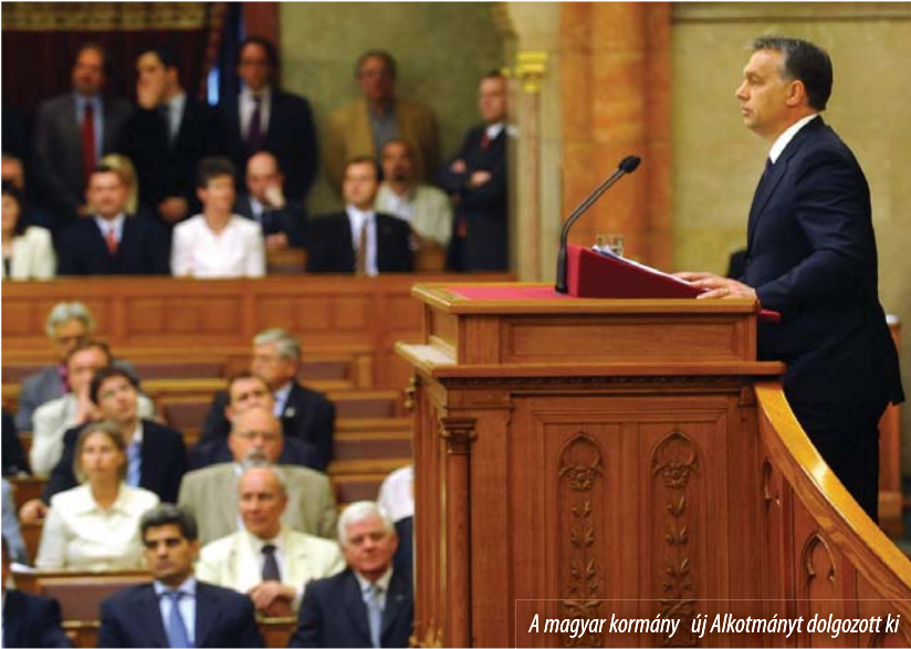
A magyar kormány új Alkotmányt dolgozott ki

Sajtótájékoztatót köszönt meg 2011. április 27-én budapesti irodájában Tőkés László , az Erdélyi Magyar Nemzeti Tanács (EMNT) elnöke, az Európai Parlament alelnöke az alkotmányozóknak, hogy az új Alaptörvényben a magyar állam határain túl élő nemzetrészekről is gondoskodtak.