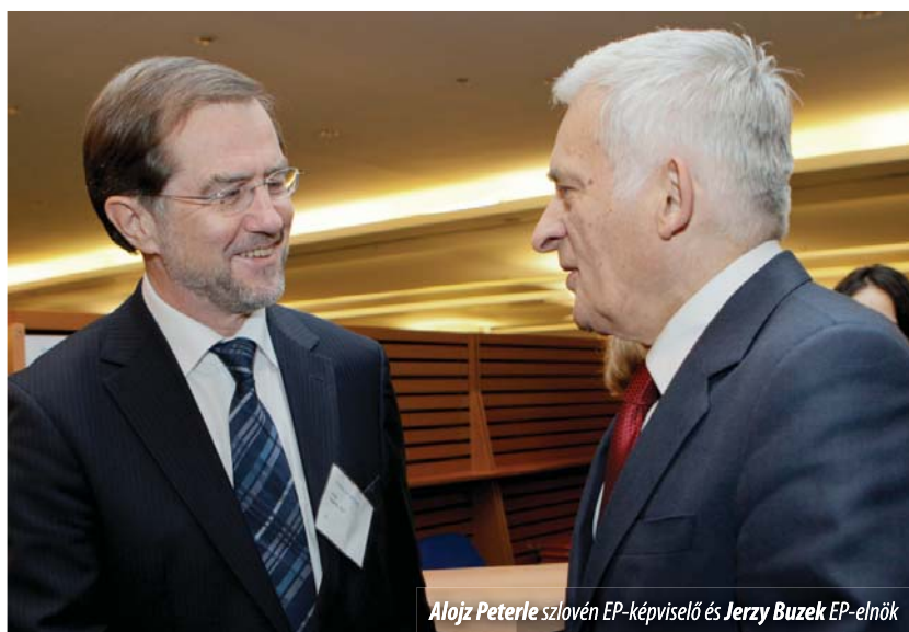
Alojz Peterle szlovén EP-képviselő és Jerzy Buzek EP-elnök