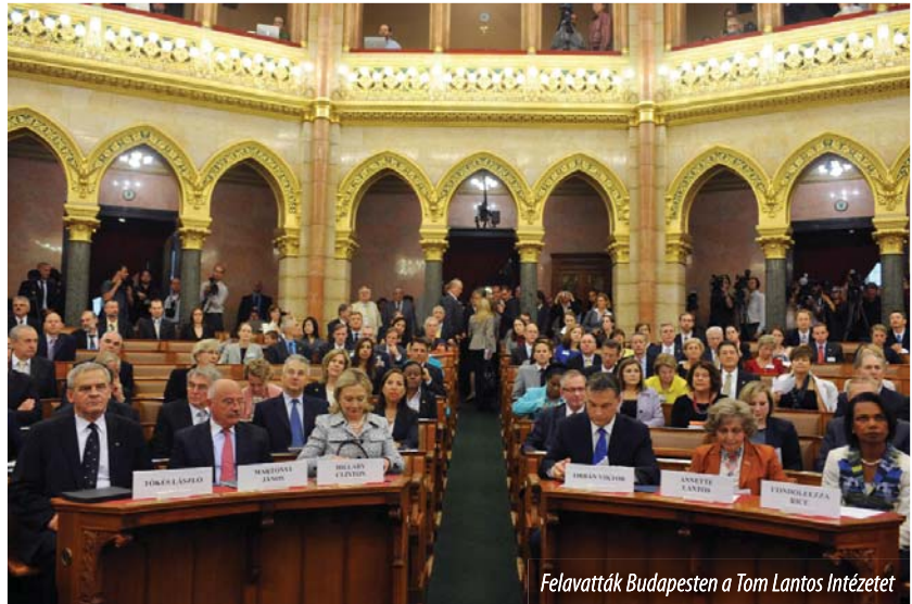
Felavatták Budapesten a Tom Lantos Intézetet