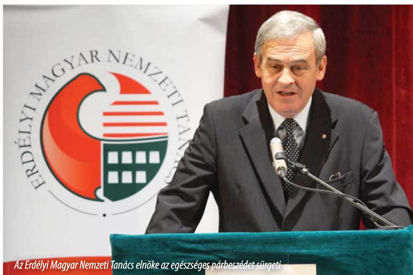
Az Erdélyi Magyar Nemzeti Tanács elnöke az egészséges párbeszédet sürgeti

– Az első kérdésre azt tudom válaszolni, hogy a közpénzekkel való átlátható és nyilvános elszámolás, főként ha a mi nehezen megkeresett adólejeinkről van szó, nem csupán egyik vagy másik párt belügye. Az erdélyi magyarok közös érdeke és joga tudniuk, hogy pénzüket mire költik el. Nézze: a romániai politikai elit már mindenféle kombinációban vezette országunkat, de végtére mégiscsak odajutottunk, hogy országunk egy csődközeli állapotból iszonyú megszorítások árán, valamint a későbbiekben általunk visszafizetendő kölcsönökből tudott valamennyire kimászni. Ilyenképpen érthető tehát, hogy adófizető állampolgárként mindenki érdekel, mire is ment el a befizetett pénzünk. Ráadásul a mi adólejeink RMDSZ-nek visszajuttatott része – amelyről most beszélünk – az erdélyi ma-