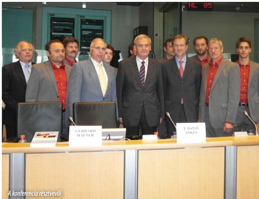
A konferencia résztvevői

▶ Tőkés László erdélyi képviselőnk beszédében azt hangsúlyozta, hogy a nemzeti kisebbségek ügye össz-európai kérdés. Volt „polgártársakként” köszöntötte a karintiai szlovén közösség jelenlévő, mintegy 120 képviselőjét, visszautalva arra, hogy egy évszázaddal ezelőtt még egyazon ország – az Osztrák-Magyar Monarchia – állampolgárai voltak. Ady Endre „magyar, oláh, szláv bánatról” és „a szolganépek Babeléről” szóló nagyívű költeményét idézve és az összefogásra vonatkozó – történelmi – kérdésére válaszolva, elérkezettnek ítélte az időt, hogy immár ne külső kényszerűségből, hanem közös akaratból és kölcsönös – európai – szolidaritásból fogjanak össze mindazok a nemzeti közösségek, melyeket egykor a Habsburg megosztó politika, utóbb pedig az ellentétes nemzeti érdekek állítottak szembe egymással. Erre az Európai Unió kínálja a legalkalmasabb keretet – mondotta képviselőnk, hasonló értelemben szólva az olaszországi szlovénekről is, akiknek hátrányos helyzetével és jogaival az EP kisebbségügyi frakcióközi munkacsoportja éppen nemrég, strasbourgi ülésén foglalkozott.