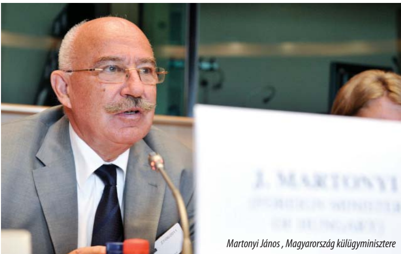
Martonyi János, Magyarország külügyminisztere

Tájékoztatójában részletesen beszámolt az elnökség eddig elért megvalósításairól és a kihívásokról, amelyekkel szembesültek. A Nyugat-Balkán legtöbb országával való kapcsolatban előrelépés történt, de még számos feladat áll előttünk, mondotta. Kiemelte annak fontosságát, hogy a Nyugat-Balkán régióban a csatlakozás útján álló egyes országok esetleges sikerei pozitív kihatással vannak a szomszédos országokra. Ez tapasztalható Horvátország esetében is, ahol sikerült három fejezetet is – mezőgazdaság, halászat, regionális politika – lezárni, és még négy fejezet maradt nyitva. Remélhetőleg az elnökség hátralevő két hetében sikerül majd ezeket is lezárni. Mindez új energiával töltötte fel a régiót, emelte ki Martonyi . Ebben a pozitív Európa-barát hangulatban jelek szerint Szerbia is előre szeretne lépni. Ratko Mladic letartóztatása és hágai kiadatása előrelépés, viszont a reformok nem késhetnek. „Támogat-