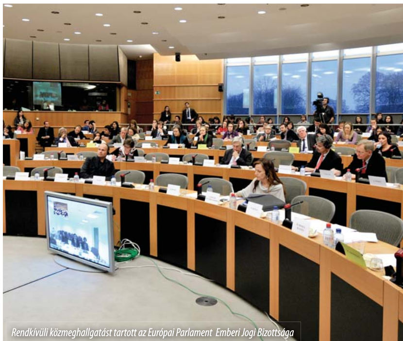
Rendkívüli közmeghallgatást tartott az Európai Parlament Emberi Jogi Bizottsága