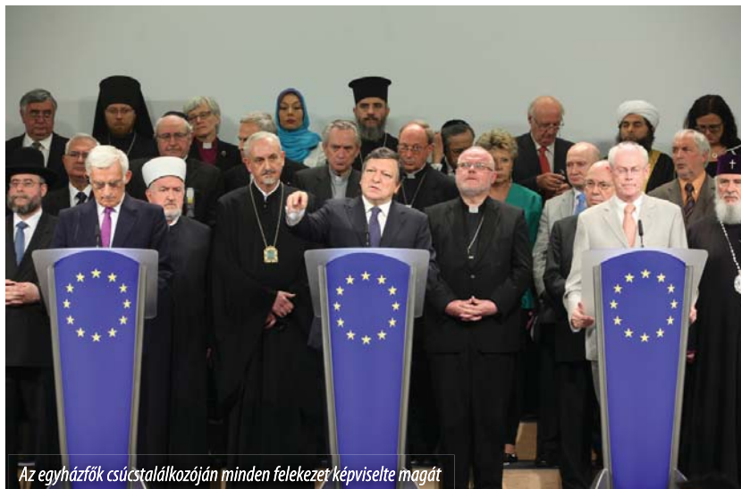
Az egyházfők csúcstalálkozóján minden felekezetet képviselte magát

lyozta, melynek alapjául a kölcsönös szolidaritás szolgál. Buzek elnök az egyházfők spirituális erejét méltatva azt emelte ki, hogy az egyházak a demokrácia, az emberi méltóság és a tolerancia szolgálata terén játszanak különleges szerepet a kontinensen. Van Rompuy elnök a maga során, a dél-mediterrán térség országaiban zajló forradalmi változásokra utalva, arról szólt, hogy a vasfüggöny leomlása nyomán Európának is megvannak azok a tapasztalatai, amelyek a demokratikus átmenetben segítségére lehetnek ezeknek az országoknak. Az észak-afrikai megmozdulások arra vallanak, hogy az iszlám és a demokrácia nem egymást kizáró értékrendet képviselnek – állapította meg a Tanács elnöke.