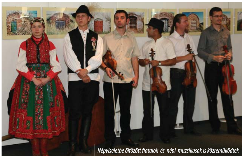
Népviseletbe öltözött fiatalok és népi muzsikások is közreműködtek