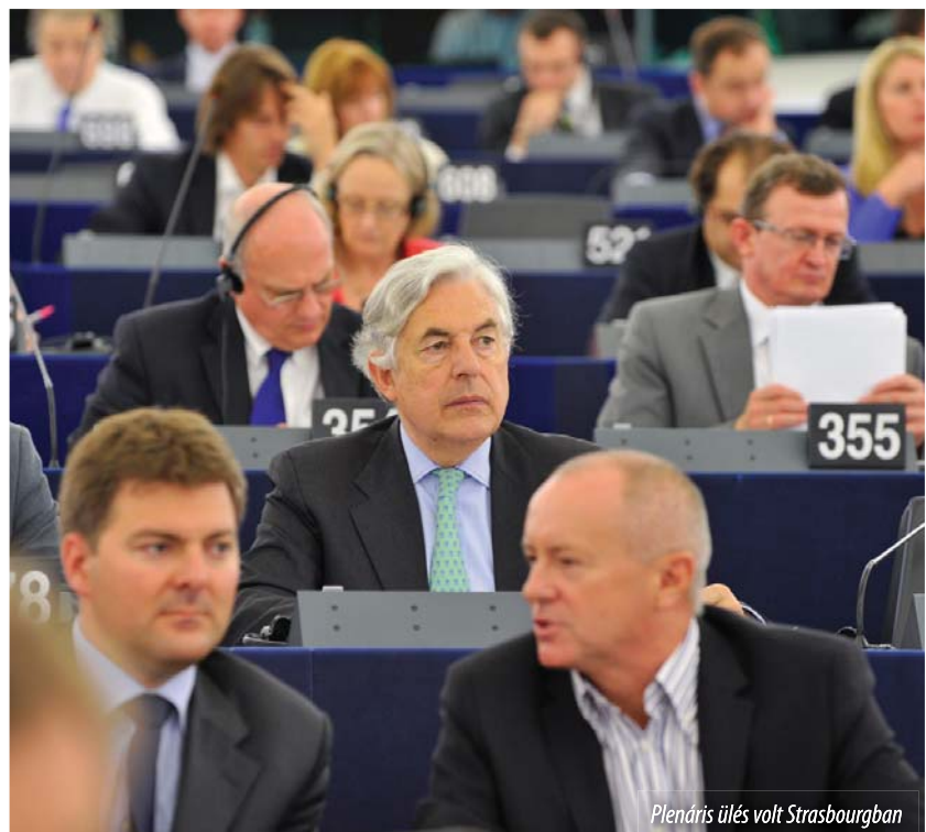
Plenáris ülés volt Strasbourgban