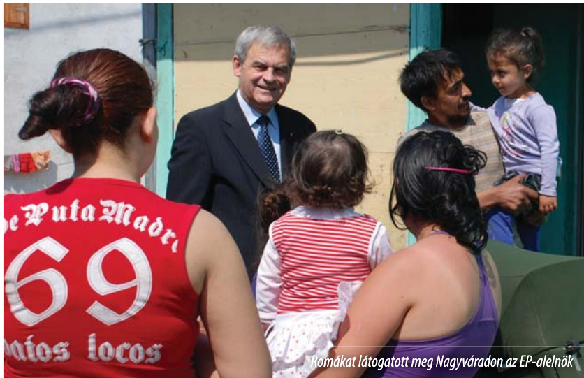
Romákat látogatott meg Nagyváradon az EP-alelnök

A kölcsönös szolidaritás jó példaként említette Tőkés László az 1990-es marosvásárhelyi Fekete Márciust, amikor a cigányok a ma-