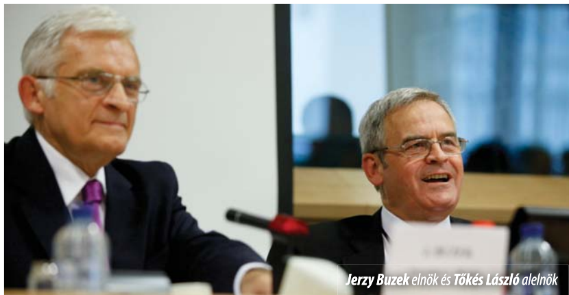
Jerzy Buzek elnök és Tőkés László alelnök

Megnyitó-beszédében Barroso elnök az Unió és az egyházak közötti partnerség szükségességét hangsúlyozta.