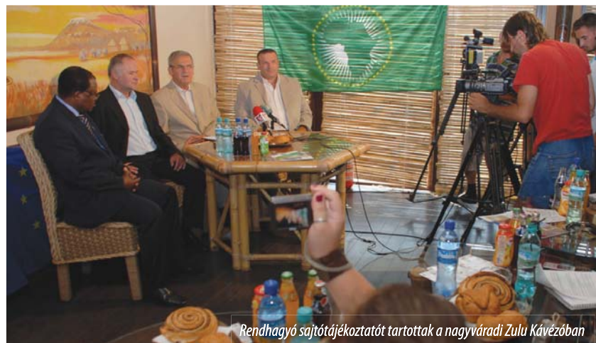
Rendhagyó sajtótájékoztatót tartottak a nagyváradai Zulu Kávézóban

tatott: mindezek mellett a régi Afrika-járó magyarok által reánk hagyományozott örökségét is megidézni a 2012. május 25. és 2013. május 25. között zajló vitorlásverseny és körút. Tőkés László beszédében a pozitív globalizmus gondolatát hangsúlyozta, amely a különböző kultúrák szépségének, gazdagságának bemutatása, egymáshoz való közeledése és összekapcsolódása által jövőbemutató és szolidaritás-erősítő jelentéssel ruházta fel a globalizáció jobbára negatív, pejoratív értelem-