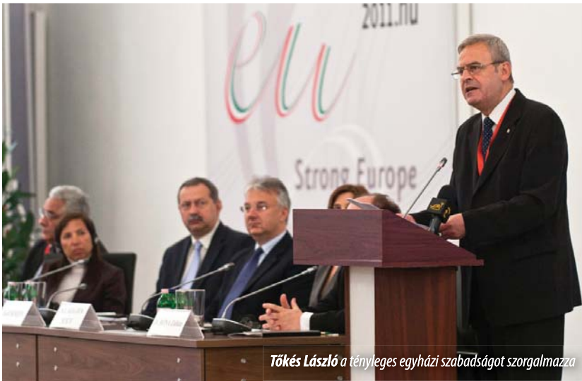
Tőkés László a tényleges egyházi szabadságot szorgalmazza

Tényleges egyházi szabadságot, hitbeli és erkölcsi megújulást sürgett Kelet- és Közép-Európa számára Tőkés László európai parlamenti alelnök egy gödöllői nemzetközi konferencián.