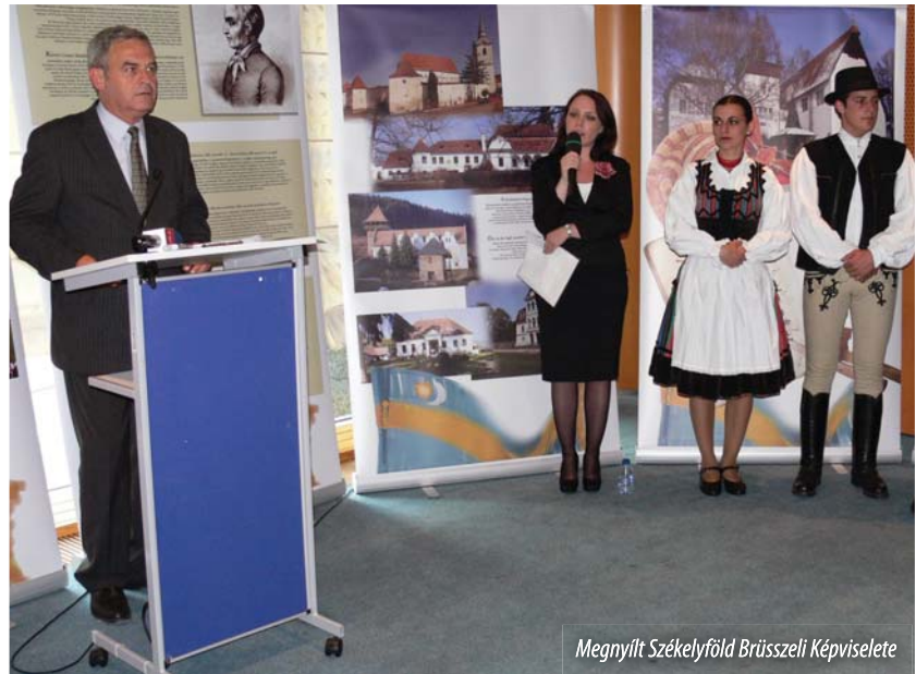
Megnyílt Székelyföld Brüsszeli Képviselete

Az eseményt felvezető székelyföldi zene- és táncbemutatót követően Tőkés László erdélyi képviselőnk megnyitó beszédében az iroda megnyitását örömteli és számos lehetőség előtt utat nyitó kezdeményezésnek nevezte, amelyre mind