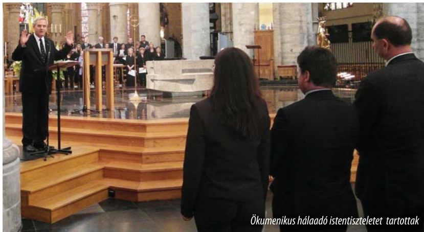
Ökumenikus hálaadó istentiszteletet tartottak

Az ünnepi szentmisét Erdő Péter , Magyarország