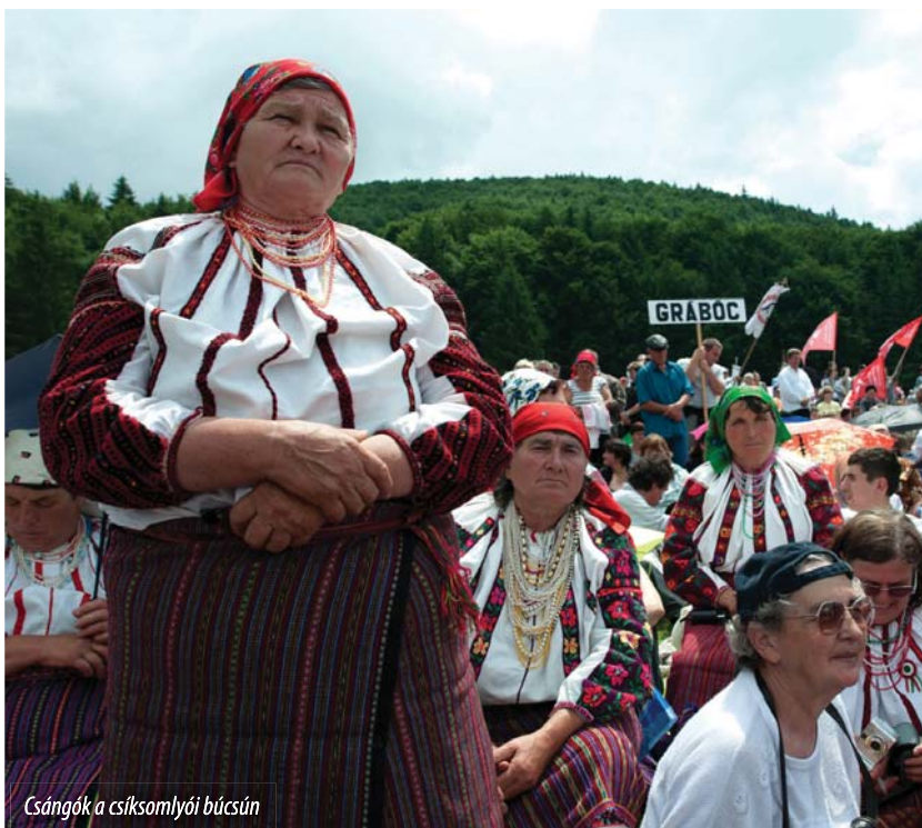
Csángók a csíksomlyói búcsún