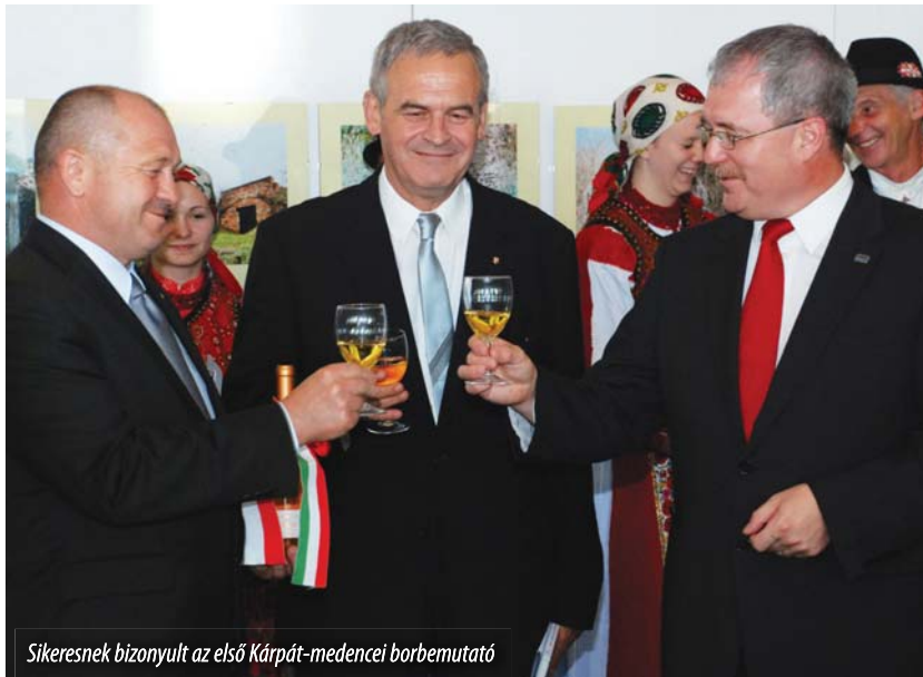
Sikeresnek bizonyult az első Kárpát-medencei borbemutató

megfosztott polgáraikat. Amint már a tegnapi megnyitón is utaltunk rá, a szovjet tábor leigázott országai-ban elszenvedett károk nagyságát érzékletes módon szemléltethetjük a XIX. század második felében pusztító filoxéravész okozta hatalmas veszteségekkel a szőlőtermesztés területén. És eme analógia mentén hadd tegyük rögtön hozzá, hogy a kommunizmus, miként az élet minden területén, azonképpen a szőlőművelés, valamint a borászat terén is katasztrófális következményekkel járt. Az 1989-es rendszerváltozást követően, volt kommunista országainknak ebből a súlyos helyzetből kell megtalálniuk a