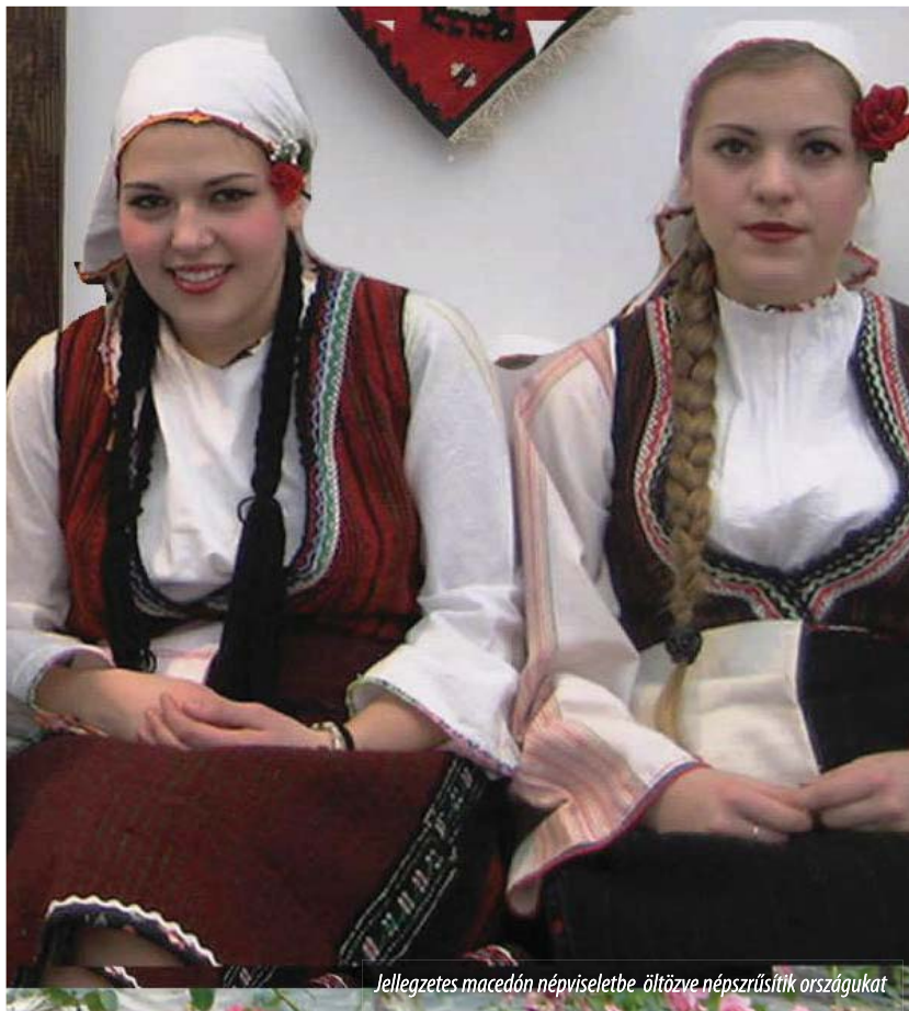
Jellegzetes macedón népviseletbe öltözve népszűsítik országukat

Felszólalásában Bernd Posselt német néppárti képviselő elsősorban az Európai Unió illetékeseit, illetve Görögországot hibáztatta a csatlakozási folyamat elhúzódásáért. Tőkés László EP-képviselőnk – a