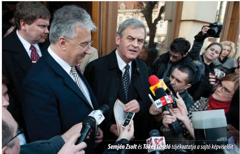
Semjén Zsolt és Tőkés László tájékoztatja a sajtó képviselőit

A rendezvényen köszöntőt mondott Németh Zsolt , a Külügyminisztérium parlamenti államtitkára. Beszédében a kormánypárti politikus is a multikulturalizmus liberális modelljének válságára mutatott rá. Mint mondta, ez idézte elő azt, hogy Európában megerősödtek a radikális, szélsőséges politikai nézetek, hogy az etnikai türelmetlenség fellángolt nemcsak Közép-Európában, hanem Európa nyugati felén is, és politika-, pártpolitika-formáló tényezővé tudott válni. Hozzátette: a multikulturalizmus közösségi azonoságtudatot megerősítő, hagyománytisztelő modellje ugyanakkor erősödik, „kibontakozás, jövő előtt áll”. Az EU alapjogi chartája ezért foglalja magában a sokszínűség tiszteletben tartását, és ezért esik egyre több szó az intézményi ga-