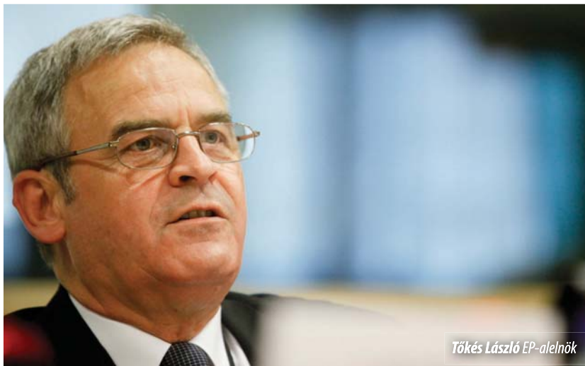
Tőkés László EP-alelnök

Tőkés László EP-alelnök irodájában fogadta az Európai Püspöki Konferenciák Tanácsának (COMECE) főtáitkárát, Piotr Mazurkiewicz 2011. április 17-én Brüsszelben, az Európa Parlament épületében. A főtáitkár tájékoztatta az Európai Parlament alelnökét arról, hogy az Anima csoport szervezésében június 29-én a nemzetközi családnappal alkalmából rendezvényt tartanak, amelyhez Tőkés László segítségét is kéri. A találkozó második felében a vallási felekezetek és világnézeti közösségek és az unió intézményei közötti párbeszéd jogi alapját megteremtő Lisszaboni Szerződés 17. szakaszának életbe ültetésének konkrét lehetőségeiről esett szó.