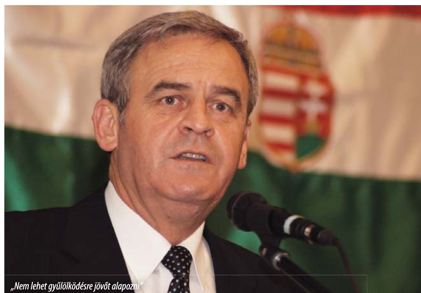
„Nem lehet gyűlölködésre jövőt alapozni”