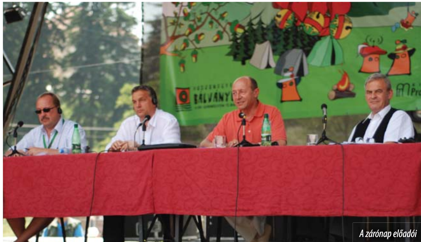
A zárónap előadói

Tőkés kifejezte „a mi államelnökünk” iránti megbecsülését, és