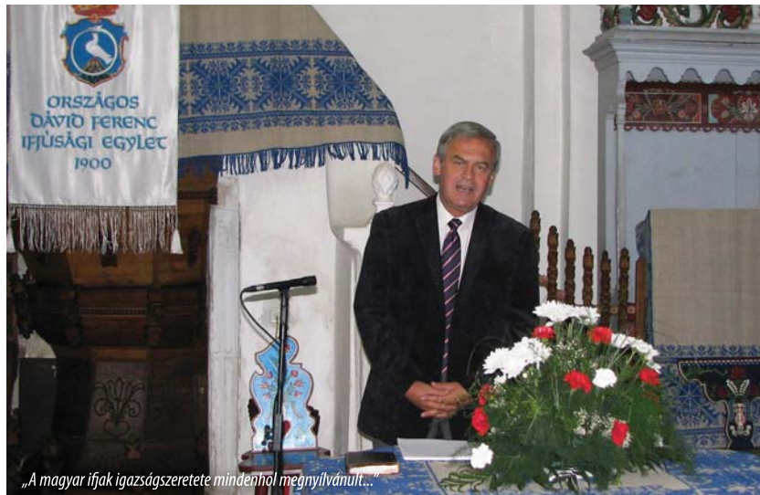
„A magyar ifjak igazságszeretete mindenhol megnyilvánult...”

Államalapító Szent István királyunk ünnepén, 2010. augusztus 20-án Tőkés László , az Európai Parlament alelnöke az Országos Dávid Ferenc Ifjúsági Egylet (ODFIE) meghívására előadást tartott a XXXIV. Erdélyi Unitárius Ifjúsági Konferencián. A zsűfólságig megtelt vargyasi unitárius templomban az erdélyi képviselő „Nemzetpolitika és az ifjúság közéleti szerepvállalása” című előadásában az értékelvűség mellett érvelt. Mint jelezte: ma az identitásvesztés az egyik legnagyobb problémánk, mintegy „szétmállik” a közösségi, lokális, nyelvi és nemzeti identitás, márpedig közszolgálatot csakis az vállalhat, aki azonosulni tud a köz problémáival, magáénak érzi azokat.