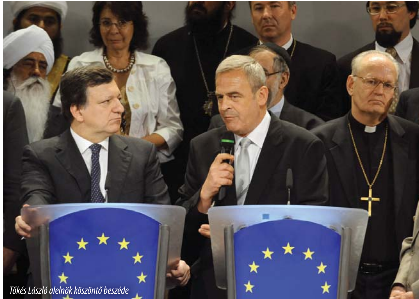
Tőkés László alelnök köszöntő beszéde

Jerzy Buzek EP-elnök felvezetőjében bemutatta az Európai Parlament vallási és egyházi ügyekkel megbízott alelnökét, Tőkés László erdélyi képviselőt, akit a diktatúrák elleni küzdelem, illetve tágabb értelemben az emberi jogokért való következetes kiállás élharcosaként jellemezte. Az ő példájából, egyházának a Ceaușescu-rezsim megbuktatásában vállalt szerepéből, valamint több más, hasonló esetből is kitűnik, hogy az egyházak társadalmi szerepvállalása minő fontossággal bír – mondotta, majd így folytatta: „Világiaknak és egyháziaknak valamennyi – helyi, országos és európai – szinten együtt kell működniük, hogy véget vethessünk a szegénységnek és a társadalmi kirekesztettségnek. Elsőbbségi célkitűzésünk, hogy helyreállítsuk a társadalmi és gazdasági biztonságot. Az egyházaknak ebben döntő szerepük lehet, hiszen a közösségek és egyének életében végzendő szociális munka terén hatalmas tapasztalatra tettek szert. Tapasztalattuk és tudásuk talán sohasem volt értékesebb, mint a jelenlegi válsághelyzetben.” Buzek elnök ugyanakkor bejelentette, hogy