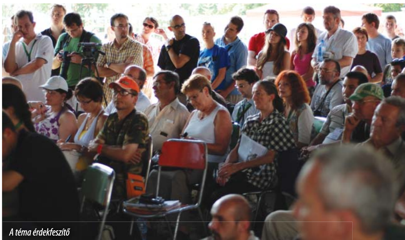
A téma érdekfeszítő