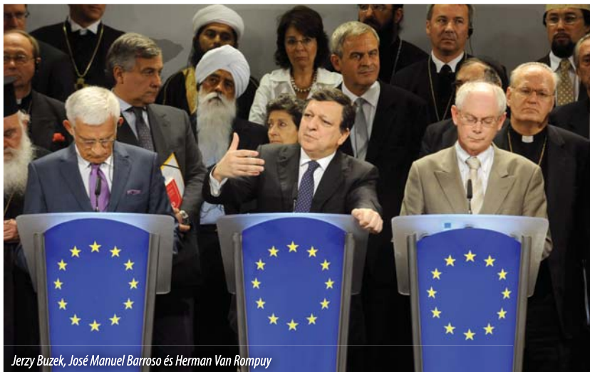
Jerzy Buzek, José Manuel Barroso és Herman Van Rompuy

Mint ismeretes, 2009. december 1-jén életbe lépett a Lisszaboni Szerződés , amelyben – az intézményes reformokon túlmenően – az EU