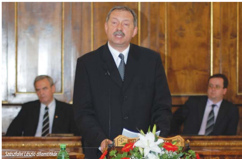
Szászfalvi László államtitkár

Az 1989-es sorsfordító esztendőt követően, ezelőtt húsz évvel a Sulyok István Református Főiskola alapítása Egyházunk nemzeti elkötelezettsége és népszolgálati hagyományai szellemében történt. Kisebbségi helyzetében kiszolgáltatott és a román nacionál-kommunista rezsim által kifosztott és tönkretett erdélyi magyarságunknak lelki és intézményi támaszra volt szüksége. Több évtizedig tartó tudatos és „szakszerű” leépítő politika nyomán ilyen természetű közösségi segélyszolgálatra egyedül tör-