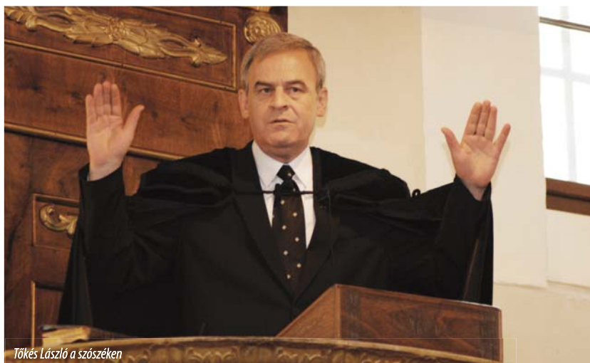
Tőkés László a szószeiken

Tőkés László EP-képviselő, a Bolyai Egyetem megszűnte után fél évszázaddal Romániában eddig egyedüli, államilag akkreditált magánegyetem, a nagyváradi Partiumi Keresztény Egyetem (PKE) elnöke az „európaiság” fogalmának problematikusságából indult ki: „Elég arra gondolnunk, hogy korunk erkölcsi válsága közepette még legjobb hagyományaink továbbvitele és elismertetése is milyen nagy erőfeszítéseket követel” – mondotta. Visszatekintésben a „helyzetteremtő” politizálás hasznáról beszélt: 1990-ben „nem ragadtunk bele az egészében véve hátrányos helyzetbe, hanem annak gyenge pontjait kihasználva, új helyzetet igyekeztünk kialakítani a magyar felsőoktatás tekintetében,