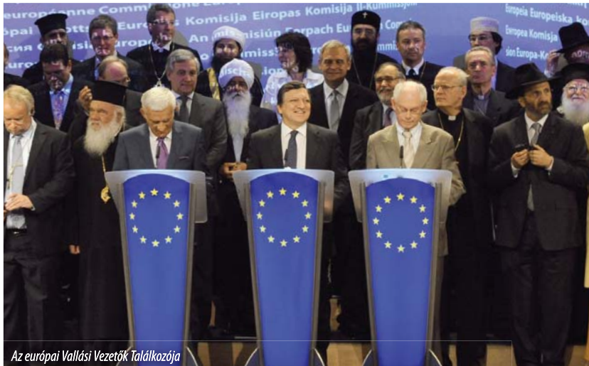
Az európai Vallási Vezetők Találkozója

lenlegi nemzetközi válság csak úgy győzhető le, hogyha az ember és a társadalmi igazságosság marad az európai politika figyelmének középpontjában.