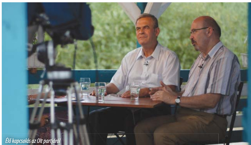
Élő kapcsolás az Olt partjáról

Tőkés László ennek kapcsán megjegyezte: sajnálatos, hogy majdnem huszonegy évvel a rendszerváltozás után még mindig élnek a nacionálkommunista reflexek, és az autonómiáról mint működő európai gyakorlatról való szabad véleménynyilvánítás jogát, illetve a gyülekezés alkotmányban is rögzített jogát elvitatva Európa- és demokráciaellenes megnyilatkozásokra ragadtatják magukat a román politikusok – ellenzéki oldalról többek között arra is felhasználva az ügyet, hogy a kormányzó demokrata-liberálisokon, illetve Traian Băsescu államfőn üssenek. Még sajnálatosabbnak tartja, hangsúlyozta az Erdélyi Magyar Nemzeti Tanács (EMNT) elnöke, hogy egyes RMDSZ-es politikusok is elhatárolódsít játszanak, némelyek egyenesen populistának bélyegezve az autonómia-küzdelemről mondotakat. Az erdélyi képviselő idézte Markó Béla romániai miniszterelnök-helyettes szavait, melyek értelmében az RMDSZ parlamentáris eszközökkel küzd a magyar közösség érdekében – ám e kettő nem zárja ki egymást, hívta fel a figyelmet Tőkés László. A közakarát kifejezésére szolgáló tömeggyűlés alkotmányos jog, egyben legitim európai gyakorlat, jelentette ki a püspök ismételten, és újságírói kérdésre azt is tisztázta: semmilyen erőszakos megnyilvánulásra nem buzdított, példaként emlegetve megannyi békés tiltakozó, vagy épp jogainkért síkraszálló