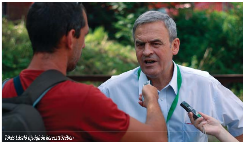
Tőkés László újságírók keresztüztüében