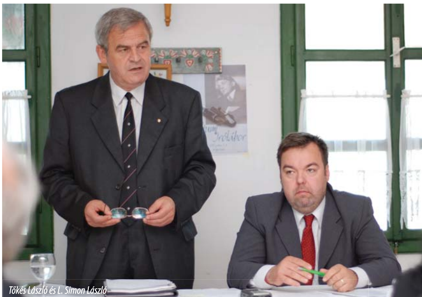
Tőkés László és L. Simon László