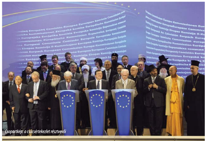
Csoportkép: a csúcsertekezlet résztvevői