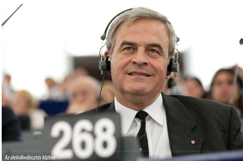
Az alelnökválasztás közben

– Az elnökség a gyakorlatnak megfelelően arra készült, hogy közfelkiáltással választanak meg, hiszen a megüresedett tisztségre a parlamenti egyezség szerint a néppárt állíthatott jelöltet, és én voltam az egyedüli jelölt. Nem voltak felkészülve arra, hogy Corneliu Vadim Tudor él az ellenvetés jogával, ami egy másik procedúra alkalmazását vonja maga után. Az elnökség nem tudta, hogy a procedúra szerint ilyen esetekben csak a támogató szavazatokot kell összeszámolni. Ezek száma pedig magasabb kell hogy legyen 186-nál, a legkevesebb szavazattal megválasztott alelnök szavazatai számánál. Én végül 334 szavazatot kaptam.