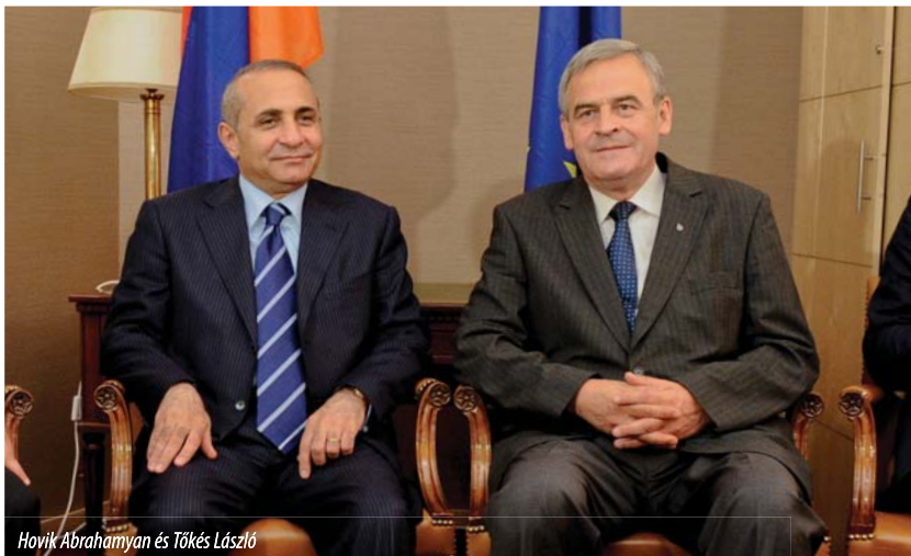
Hovik Abrahamyan és Tőkés László