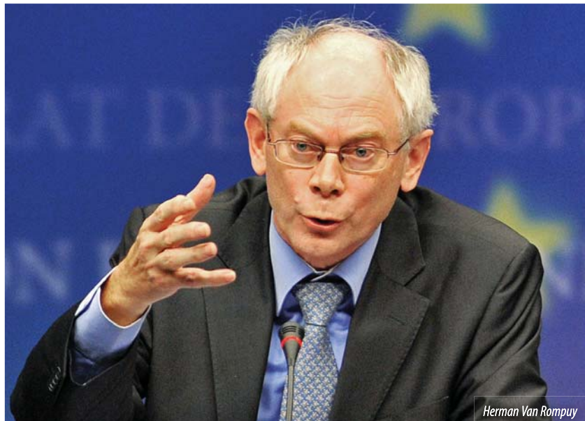
Herman Van Rompuy