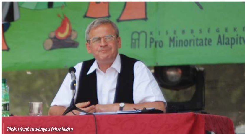
Tőkés László tusványosi felszólalása