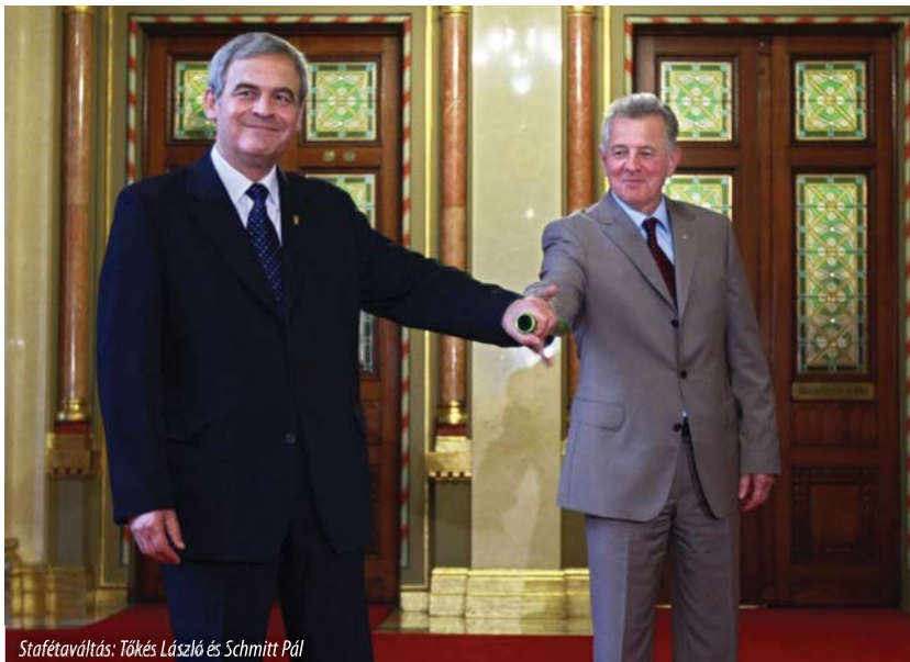
Stafétaváltás: Tőkés László és Schmitt Pál

Schmitt Pál , a Magyar Országgyűlés elnöke ma, 2010. június 18-án hivatalában fogadta Tőkés László erdélyi képviselőt, az Európai Parlament frissen megválasztott alelnökét. A találkozó apropóját épp ez adta: mint ismeretes, korábban Schmitt Pált választották az EP első magyar alelnökének, leköszöntével a magyar néppárti delegáció erre a pozícióra jelölte Tőkés Lászlót, és a püspököt néppárti támogatással ezen a héten kedden választották meg első erdélyi magyarként, egyben a román delegáció tagjaként is a magas tisztségbe.