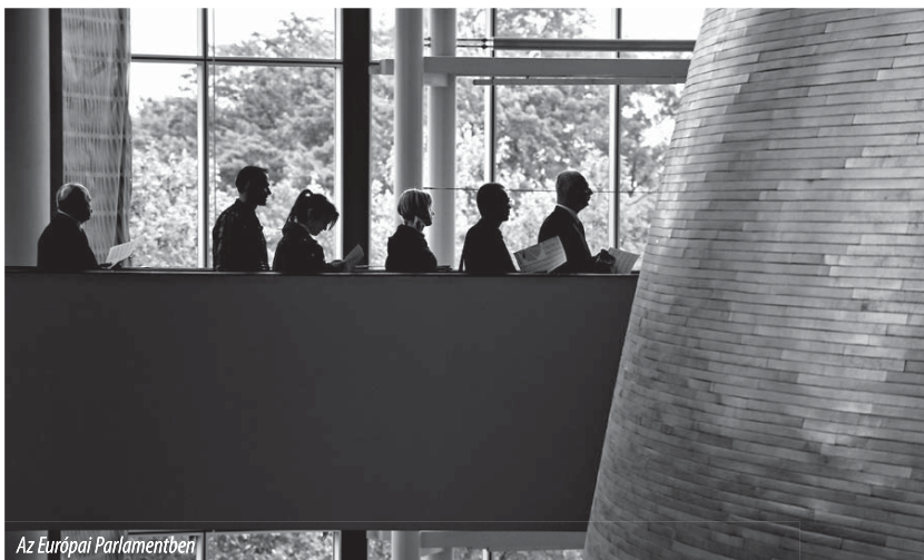
Az Európai Parlamentben

A 2010. június 14–17-i plenáris ülészak kezdőnapján, Strasbourgban több képviselő is napirend előtti felszólalásában foglalkozott a közép-európai térség országait sújtó árvizek ügyével, az Európai Unió gyors és érdemi hozzájárulását kérve az érintett tagországok – Lengyelország, Szlovákia, Csehország és Magyarország – károsultjainak megsegítéséhez.