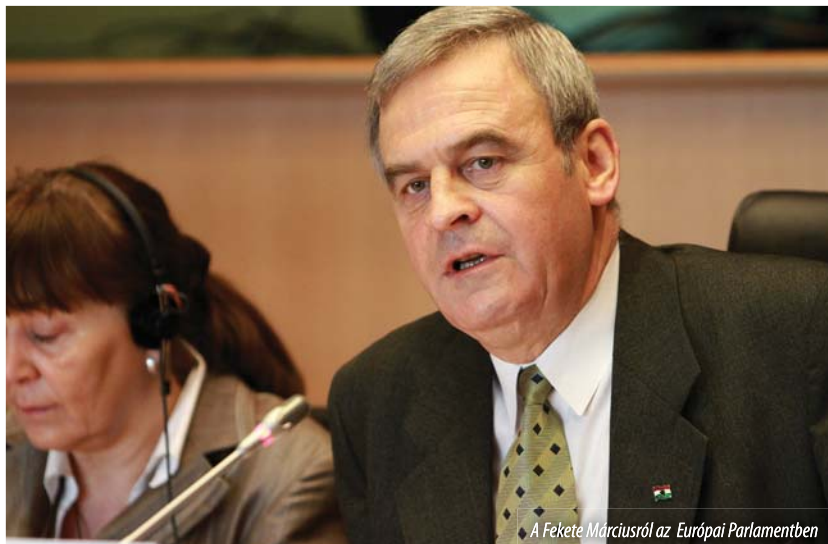
A Fekete Márciusról az Európai Parlamentben

– Erőltetett militarizálás: kis túlzással lassan minden székely mellé lehetne állítani egy hegyivadászt vagy csendőrt. Agresszív ortodox expanzió a katolikusok és protestánsok lakta Székelyföldön: például Nyárádszeredában annak a néhány helyi román lakosnak már a harmadik ortodox templomot akarják felépíteni, persze a központi költségvetés terhére, vagyis a mi pénzünkön (itt jegyezném meg: az elmúlt húsz évben közel 2000 ortodox templomot és 40 kolostort építettek csak Erdélyben!). A román kormány intézményein keresztül átláthatatlan módon támogatott ingatlan- és